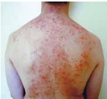
Patient, männlich, 35 jährig, mit allergisch-juckenden Hautausschlägen vor der Behandlung

davon betroffen. Sogar im Säuglingsalter erscheinen immer öfter Krankheitsbilder, die man früher so nicht kannte, z.B. Milchschorf oder Hautausschläge. Unter den Erscheinungen findet man von leicht geröteter, trockener Haut,